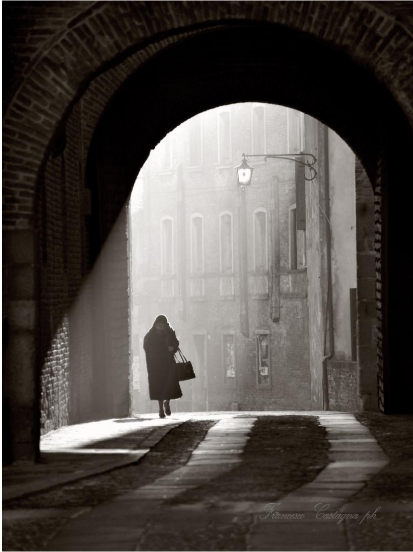
Bianco e nero