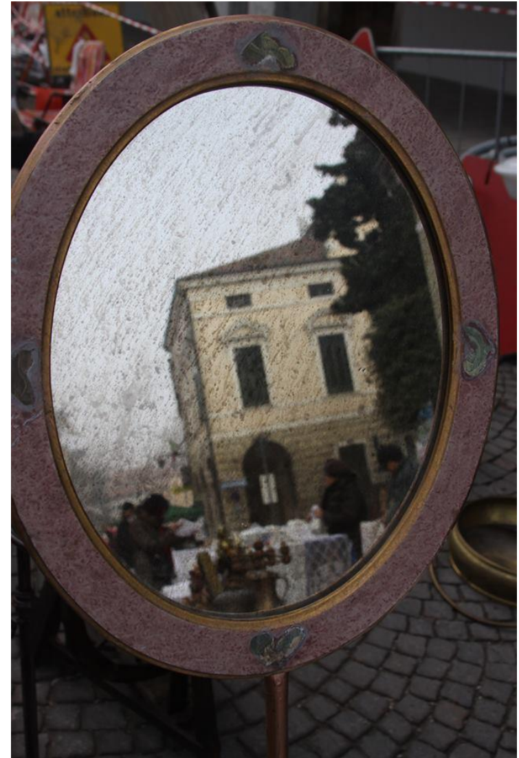
Categoria: Autunno Vintage in Montagnana. Autore: Gabriele Ferrarese, Venezia. Premio: Cena per due Enoteca Hostaria Zonarotti.