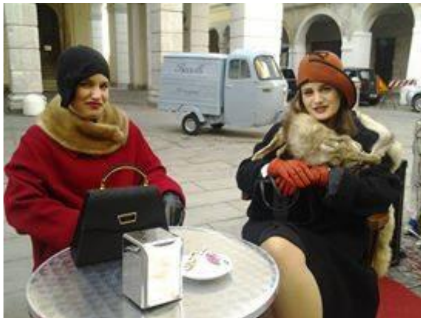
Categoria: Autunno Montagnana in Vintage. Autore: Stefano Saoncella, Urbana. Premio: Cena per due Trattoria da Stona.