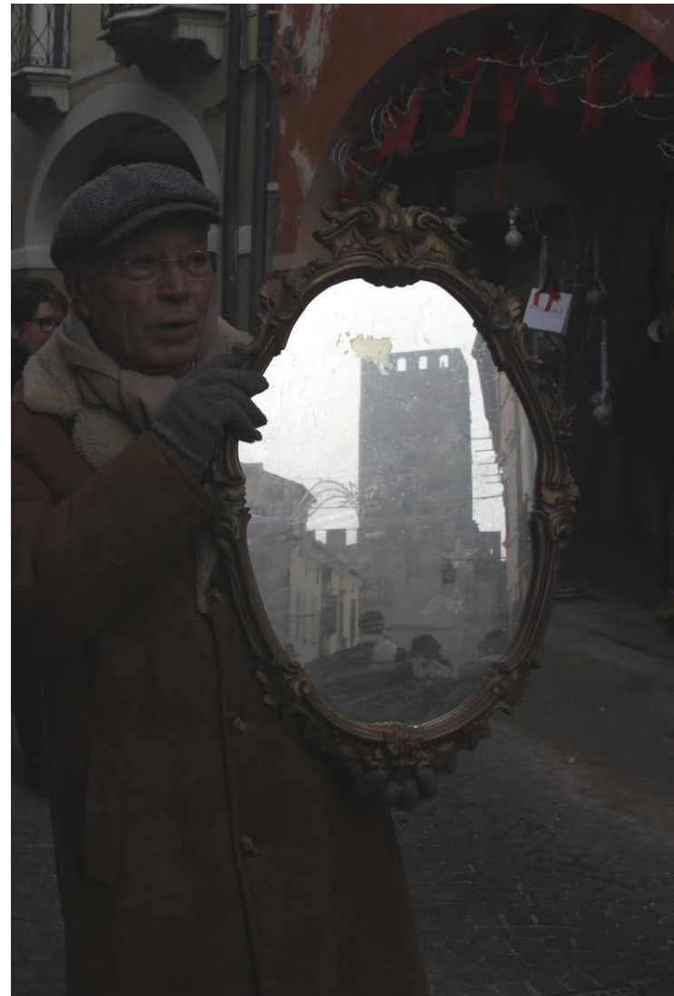
Categoria: Autunno Montagnana in Vintage. Autore: Bruno Pietro Spolaore, Venezia. Premio: Week-end per due Albergo Ristorante Aldo Moro.