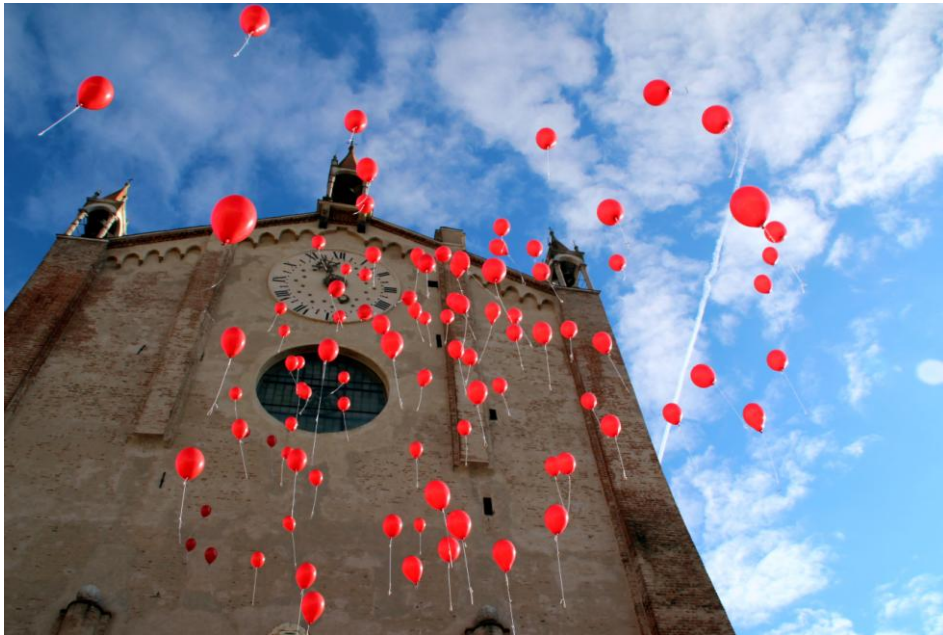
Categoria: Ricordo di Montagnana. Autore: Fulvio Mantoan, Montagnana. Premio: Cena per due Hostaria Zonarotti.