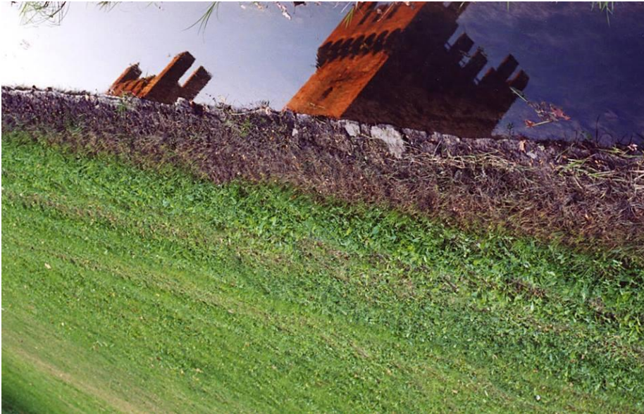
Categoria: Ricordo di Montagnana. Autore: Raphael Gallus. Premio: Week-end per due Albergo Ristorante Aldo Moro.