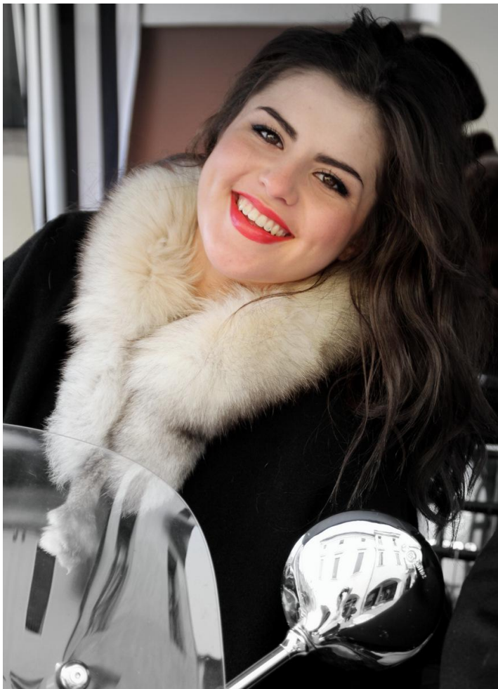
Categoria: Ricordo di Montagnana. Autore: Fulvio Mantoan, Montagnana. Premio: Cena per due Trattoria da Stona.