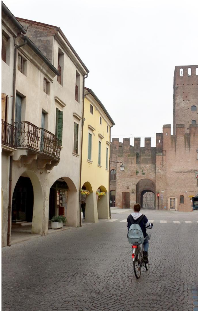
Categoria: Ricordo di Montagnana. Autore: Teresa Blandamura, Roma. Premio: Cena per due Ristorante Pizzeria Palio