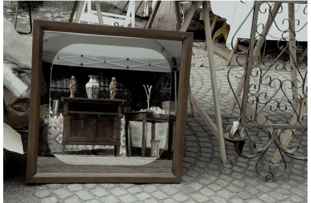
Categoria: Autunno Vintage in Montagnana. Autore: Mara Pelosin, Venezia. Premio: Cena per due Ristorante Pizzeria Palio.